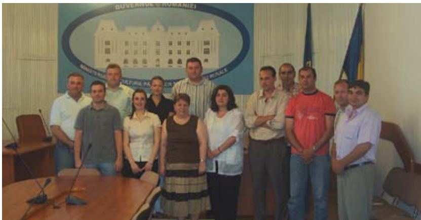
Učesnici putovanja u rumunskom Ministarstvu poljoprivrede, šumarstva i ruralnog razvoja