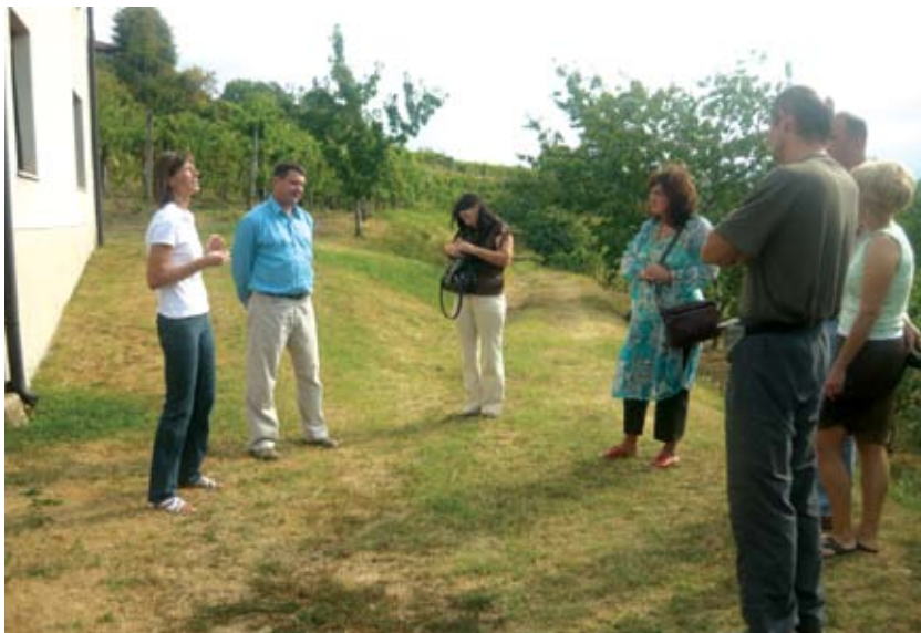
Predstavnici opštine Irig tokom posete vinariji „Šibau“ u Sloveniji