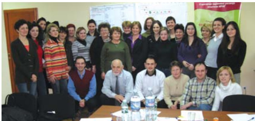
Najviše polaznika treninga Upravljanje projektnim ciklusom bilo je u Irigu

Svrha obuke iz upravljanja projektnim ciklusom bila je informisanje učesnika o ključnim principima i standardima u ovoj oblasti. Učesnici su prošli obuku o primeni procedura za programe finansiranja EU, o upravljanju projektima, rešavanju problema, stvaranju budžeta, i monitoringu rezultata projekta. Fokus ove obuke bio je popunjavanje formulara za predloge projekata CBC inicijativa.