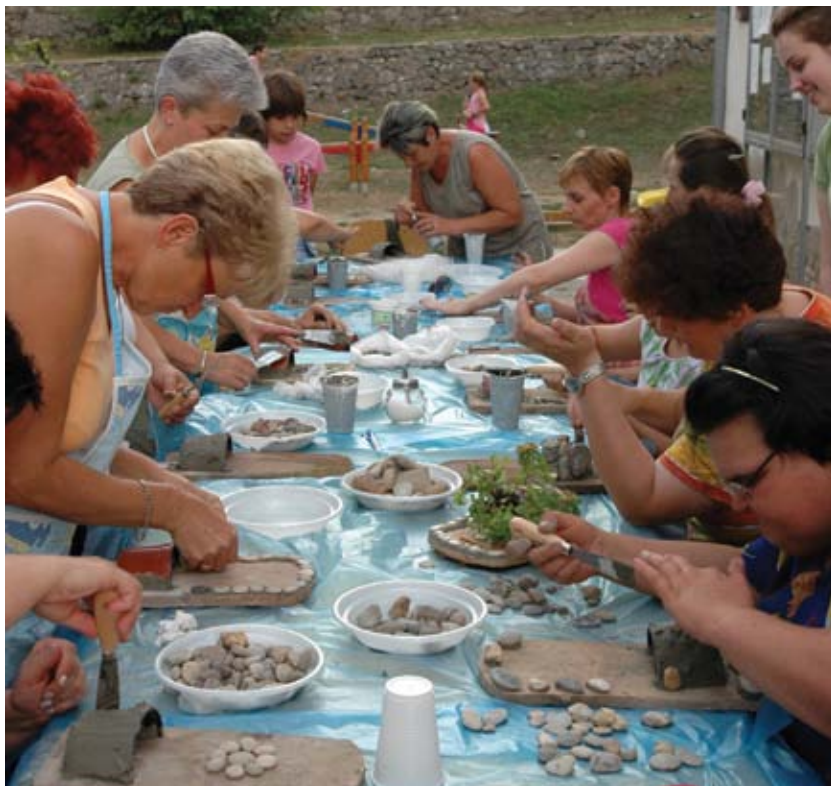
Jedna od 25 organizovanih radionica za izradu suvenira u kojoj su učesnici naučili da izrađuju suvenire od kamenčića

Ovaj projekat omogućio je učesnicima da dođu do praktičnih saznanja o upravljanju brendovima u vinarstvu. Posete proizvođačima vina u Sloveniji i Hrvatskoj organizovane su zato što su te zemlje uvele brendove vina sa lokalnim poreklom i imaju iskustva u procedurama brendiranja.